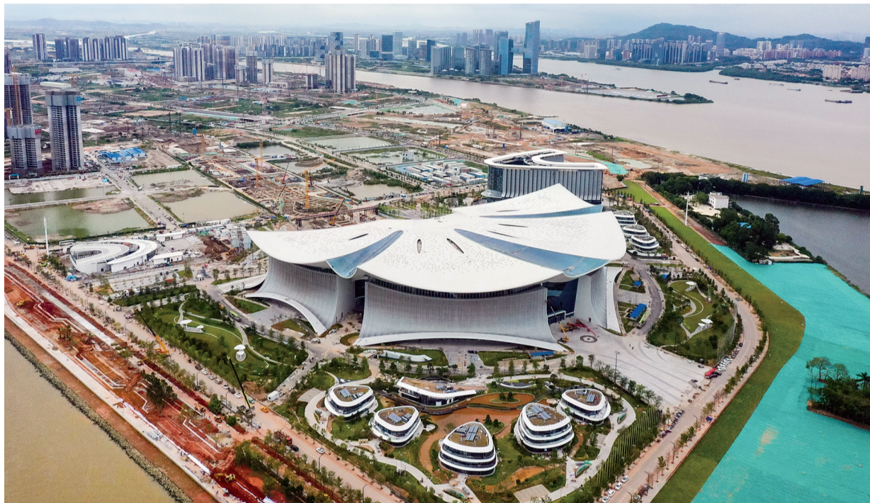
中国能建开建设的南沙国际金融论坛(IFF)永久会址项目近日竣工,即将投入使用。国际金融论坛是全球金融领域高级别常设对话交流和研究机构。图为国际金融论坛(IFF)永久会址。

聚焦改革重点履行监督职责。 认真落实安徽省委深改委交办任务,以安徽省两办名义印发《安徽省市