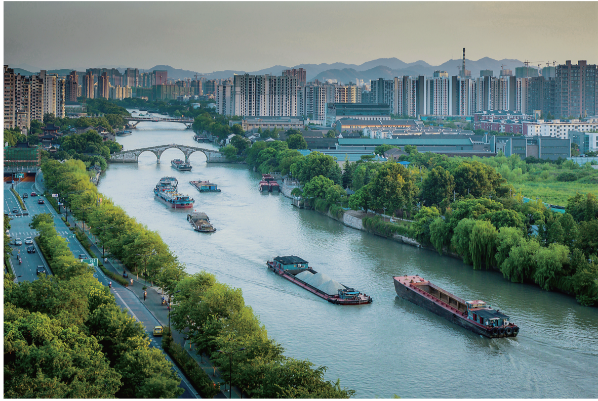
京杭大运河杭州段

杭州市发展改革委同相关区县,积极谋划园类、馆类、文化类、遗址类等八大类标志性项目,共梳理相关项目约71个,总投资超600亿元。目前,运河中央公园、运河体育公园、运河文化艺术中心已建成投入使用;大城北中央