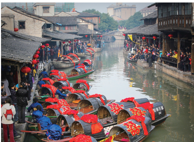
绍兴安昌古镇具有水乡风情的水上婚礼