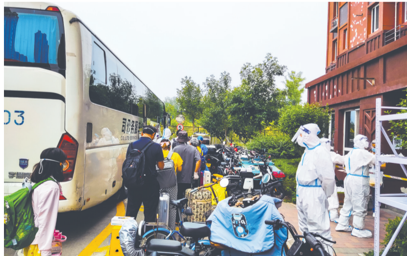
乘坐大巴,准备去酒店隔离

便主动把自己隔离,没有回到小区。他确诊后,小区经过核酸采样、消毒等处理后,只封控了10几个小时就解封了。