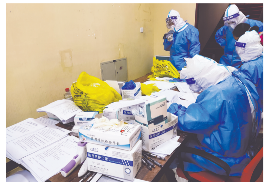
填满各种表格后进入酒店

一天,一辆大卡车不知道从哪里拉来几车上,卸到了空地上。一个光着膀子的大爷,每天都在那里忙碌。他先是