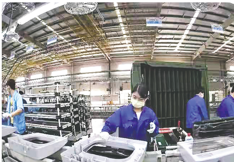
肥西经开区TCL家电产业园冰洗生产车间