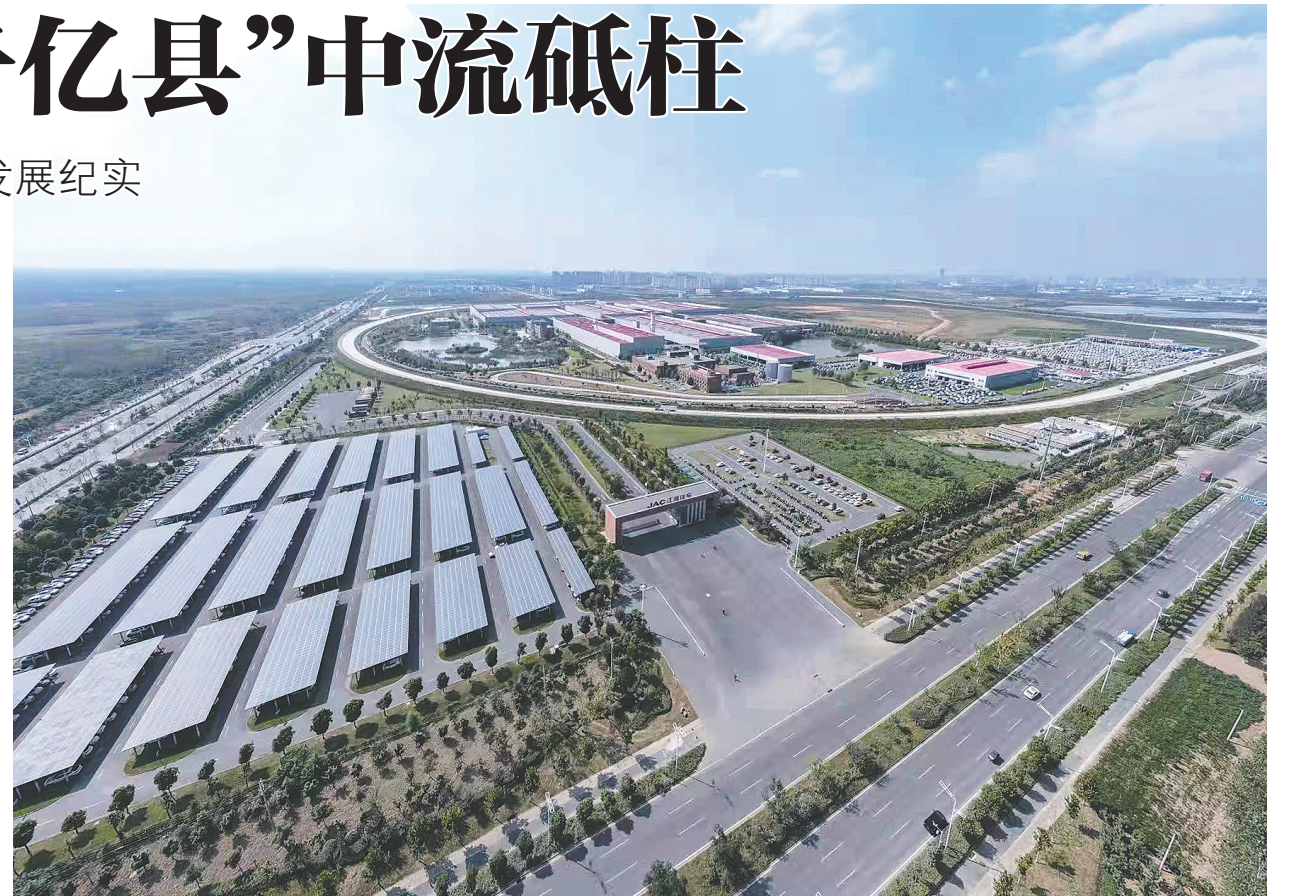
肥西经开区江汽轻卡新港基地

如今肥西县、肥西经开区都站在了开放的潮头浪尖。作为合肥西南主城区重要组成部分，优越的区位优势与基础设施配套赋予肥西得天独厚的发展根基。长三角一体化发展、“一带一路”节点城市、国家综合枢纽城市、G60科创走廊节点城市、合肥都市圈、安徽自贸试验区启动建设等一系列政策机遇叠加，为肥西发展带来无限机