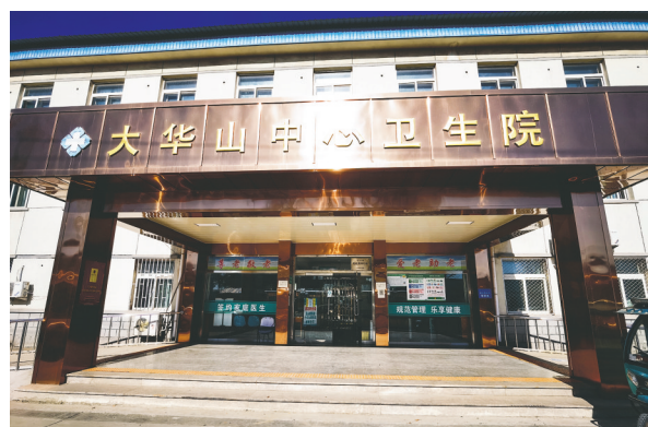
大华山卫生院办公楼

疫情就是命令，必须抢占先机，火速排查，阻断传播。组织核酸采样排查，大华山中心卫生院必须首当其