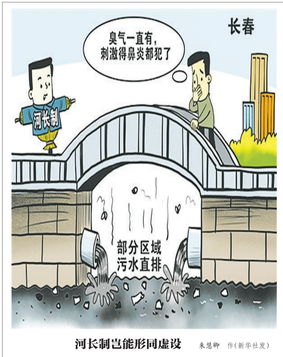
河长制岂能形同虚设

第一批国家公园设立是新起点。在多年试点中,我们在生态修复、体制机制等方面都积累了不少经验,但也存在一些挑战,一些地方保护与发展的矛盾仍然尖锐。要继续探索如何更科学发挥国家公园的多种功能,走出一条符合中国国情的国家公园建设之路,让国家公园守得住绿水青山、对得起子孙后代。