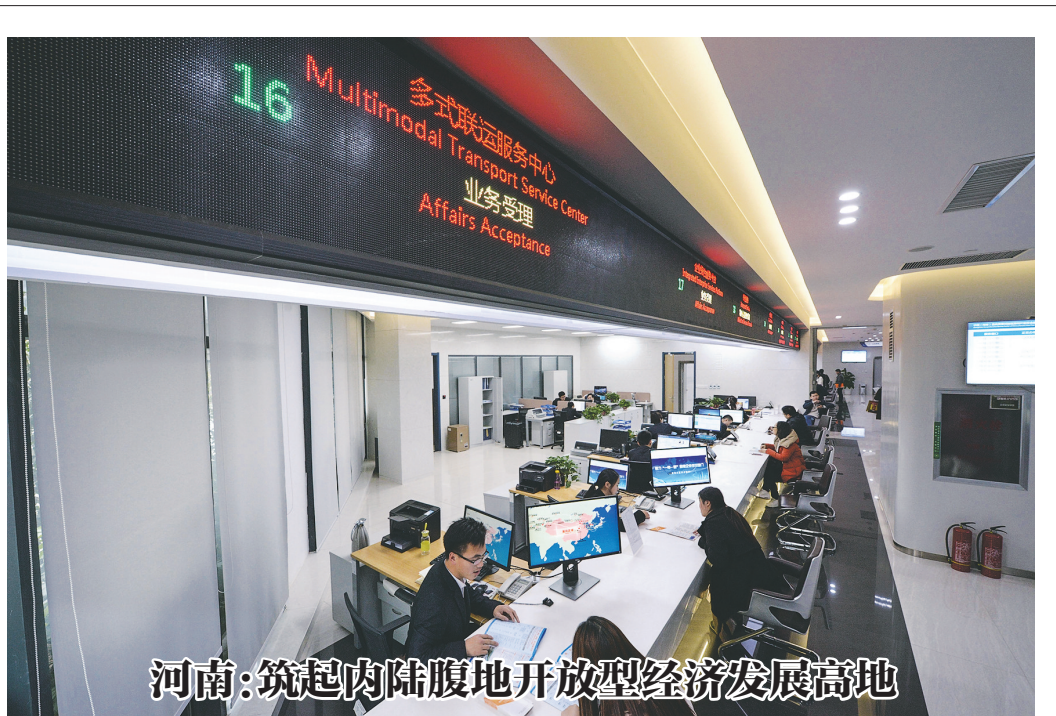
河南：筑起内陆腹地开放型经济发展高地

商务部将会同国家知识产权局、农业农村部等部门，与对方积极沟通，推动形成在欧盟保护地理标志的相关指引，并通过双边渠道做好有关地理标志产品的推广和宣介。也希望有关地方和企业关注相关进展，把握机遇，用好中欧地理标志协定，扩大出口，增加营收。