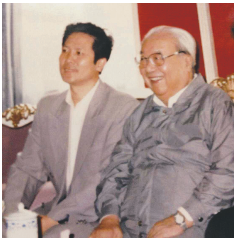
胡延清(左)与费孝通敞开心扉促膝交谈