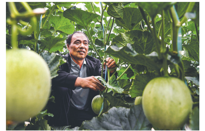
秦岭小镇铺就家门口致富路

浙江省发改委节能处相关负责人向记者透露,即将印发的《浙江省用能权有偿使用和交易管理暂行办法》显示,浙江省用能权交易分七步实施,即买卖双方提出申请、申请材料审核与受理、第三方机构确权审核、发布公告、预交易、签订交易合同、交易履约。完成交易后,由节能主管部门会同统计部门划转指标,并接入重点用能单位能耗在线监测系统。