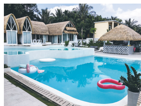
三亚市博后村民宿“宿约107”设计精致