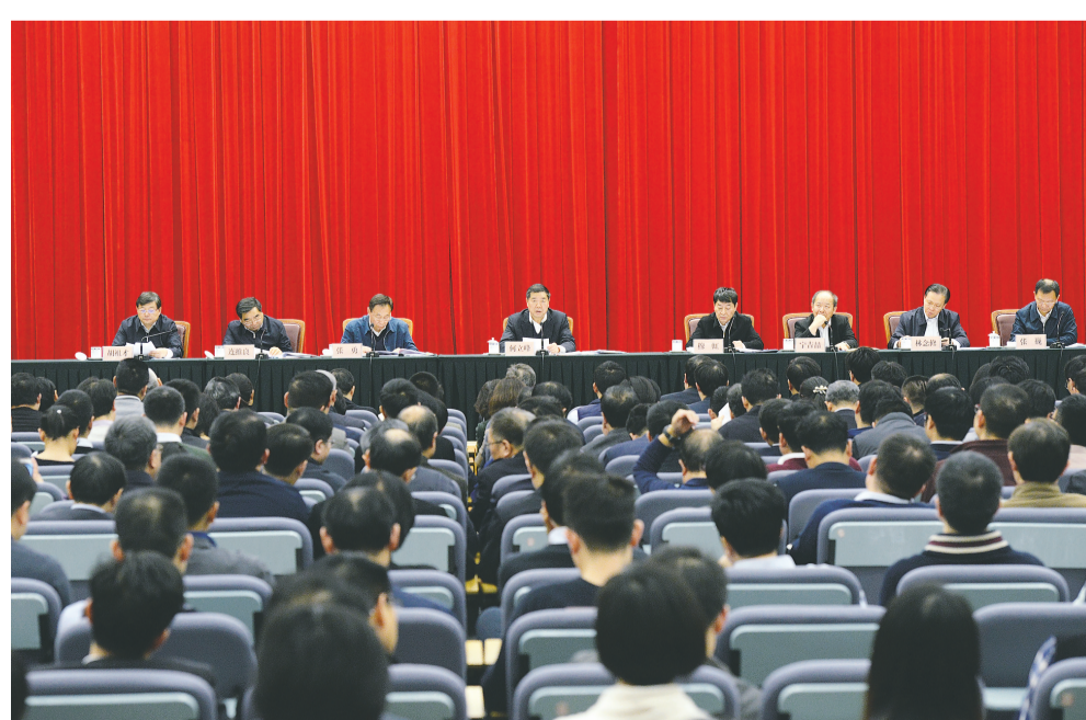
12月18日下午,国家发改委党组召开理论学习中心组学习扩大会议,传达学习习近平总书记在庆祝改革开放40周年大会上的重要讲话,回顾总结发展改革部门在改革开放中的工作历程,部署落实庆祝改革开放40周年大会精神。图为大会会场。

国家发改委党组成员、部级老同志,秘书长、副秘书长,机关副处级以上党员干部,直属、联系单位领导班子成员,离退休干部党支部书记共计约700人参加会议。