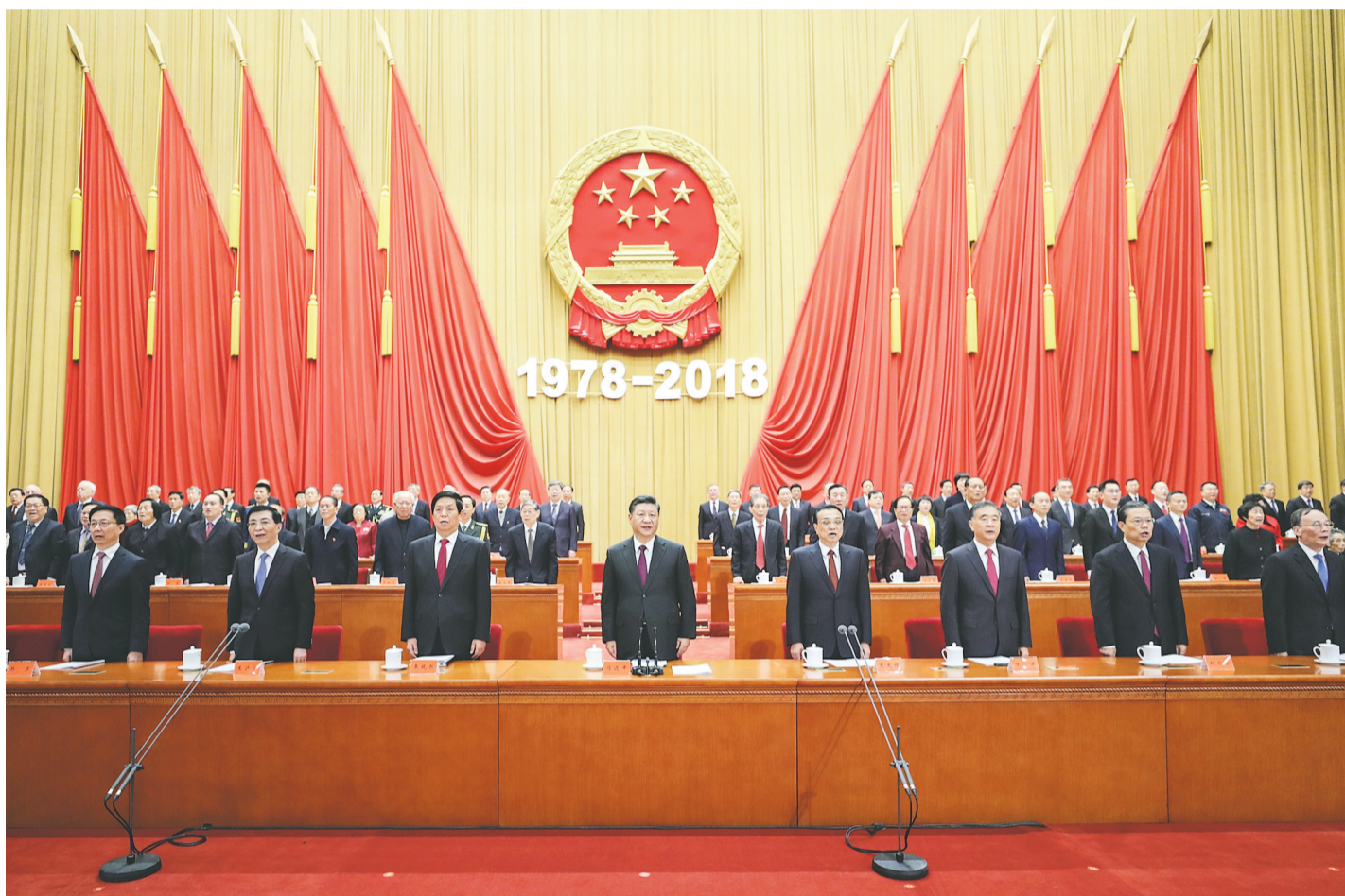
12月18日,庆祝改革开放40周年大会在北京人民大会堂隆重举行。习近平、李克强、栗战书、汪洋、王沪宁、赵乐际、韩正、王岐山等出席大会。

新华社北京12月18日电 庆祝改革开放40周年大会18日上午在北京人民大会堂隆重举行。中共中央总书记、国家主席、中央军委主席习近平在大会上发表重要讲话。