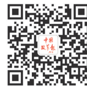
中国改革报 微信公众号