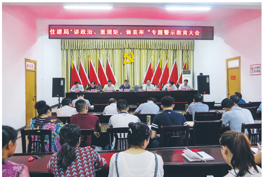
灵璧县住建局“讲政治、重规矩、做表率”专题警示教育大会现场