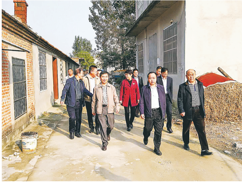
灵璧县委书记刘博夫(前排右二)督查农村人居环境治理情况

强服务，不断提高群众满意度。一是建立《支部书记述职述廉制度》《党员公开承诺制度》，各支部书记围绕理想信念、履行职责、服务群众、工作作风等方面进行述职述廉和公开承诺。二是民主评议党员，按照“学习教育、自我批评、民主评议”程序，对党员德、能、勤、绩、廉、学进行评议，促进党员履职尽责。三是积极受理群众诉求事项，对群众反映比较集中的惠众苑等老旧小区的绿化、车棚、给排水等基础设施配套问题进行统一改造，解决了住宅户的后顾之忧。