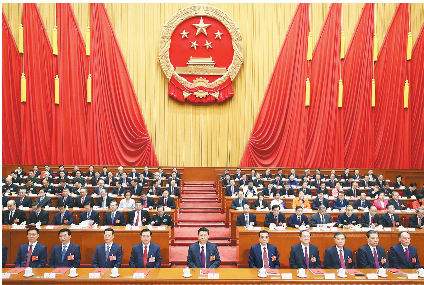
3月20日,第十三届全国人民代表大会第一次会议在北京人民大会堂闭幕。中共中央总书记、国家主席、中央军委主席习近平发表重要讲话。